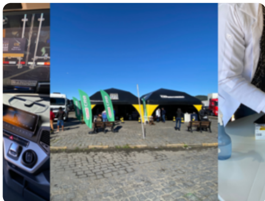
11 de Setembro de 2021