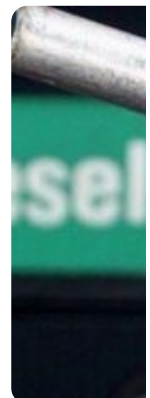
26 de Nov