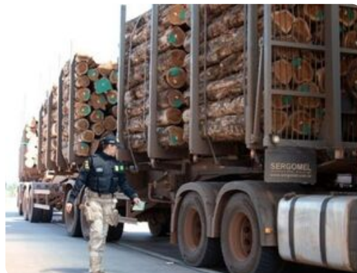
12 de Maio de 2022